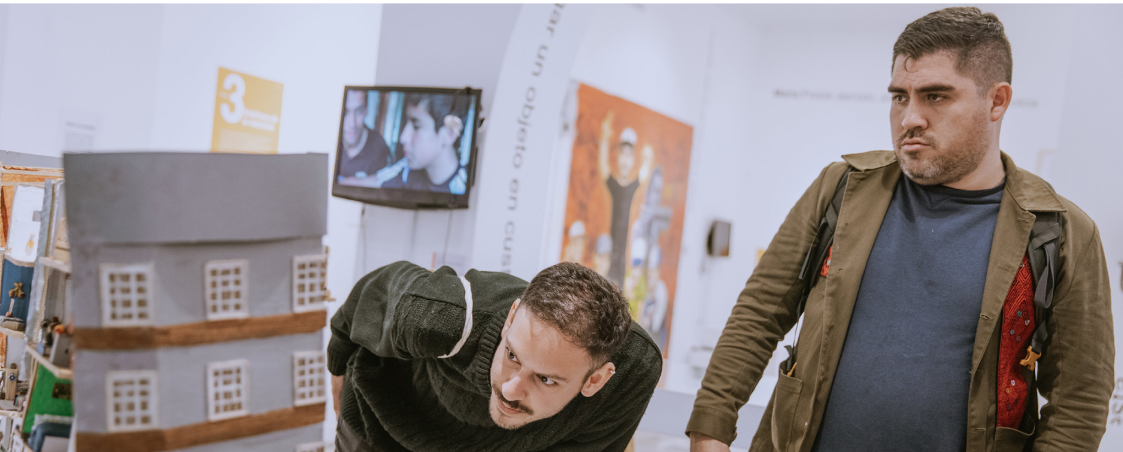
Exposición La Esquina Redonda. Autor: Andrés Rincón Aguas @andresrincon1

Sin duda una de las banderas de la gestión de los senderistas FUGA ha sido la generación de espacios para el encuentro y el diálogo. Por eso, al finalizar el 2022 quisimos resaltar una buena práctica que involucra la integridad, la transparencia y la gestión del conocimiento y la innovación: el «Co-Laboratorio Esquina Redonda en el Bronx Distrito Creativo» una caja de herramientas para reconstruir la memoria a través de las voces de actores históricamente excluidos, que pueden encontrar aquí: https://fuga.gov.co/publicaciones/caja-de-herramientas-cultural