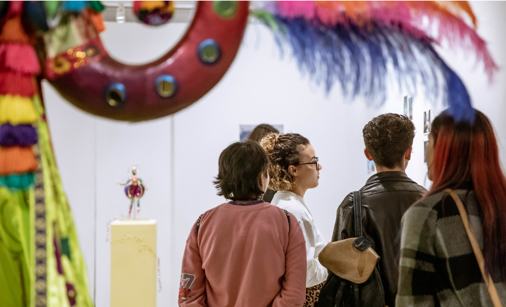
Salas de Exposición FUGA. Autor: Andrés Rincón Aguas @andresrincon1

‘presencial’ de la herramienta para recopilar recomendaciones para la formulación del plan de gestión de la integridad FUGA 2023, con el propósito de alinear las expectativas ciudadanas y de colaboradores públicos en la gestión institucional, identificar oportunidades de mejora en la entrega de bienes y servicios y finalmente, mejorar la percepción ciudadana sobre la prevención de la corrupción.