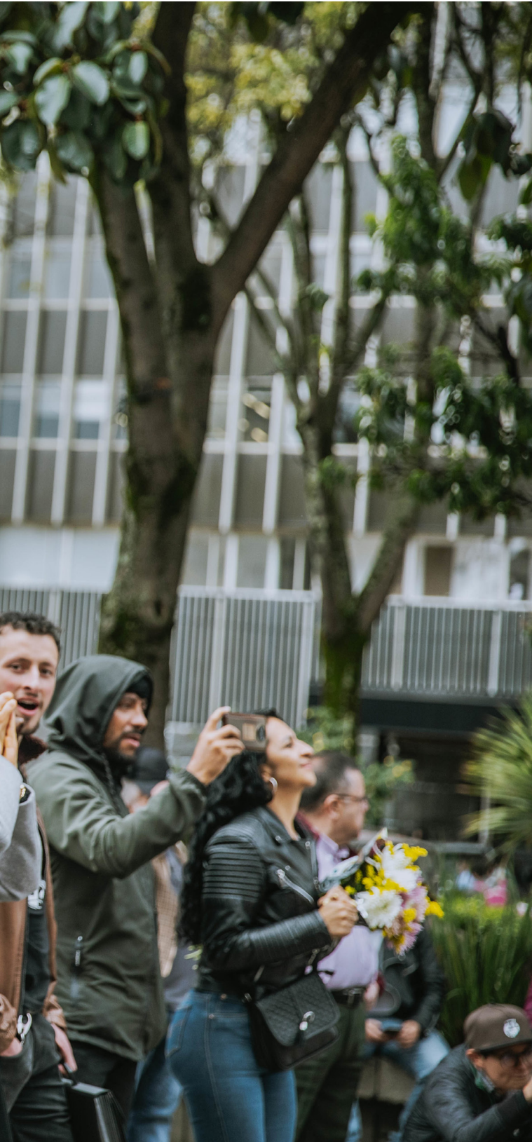
Reactivación Parque Santander.

En la FUGA todos trabajamos por un propósito en común: articular y gestionar la vitalización y transformación del Centro de Bogotá, a través de su potencial creativo, artístico y cultural, de la mano de los artistas, agentes culturales, colaboradores y ciudadanía en general.